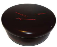
菓子器 松葉絵ヤンボ