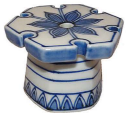
薄茶器 蓋置 墨台