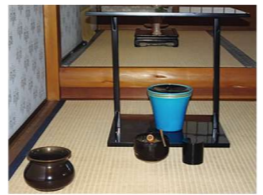
棚 真塗 四方棚