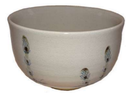
茶碗 替 尾戸焼