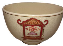
茶碗 替 薩摩焼